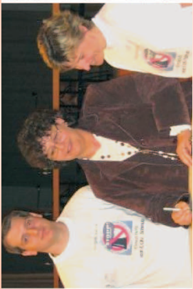
Bürgermeisterin Disser unterstützt