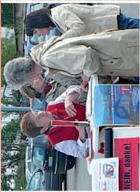
Infostand bei Wind und Wetter