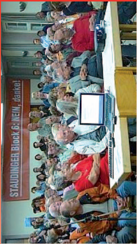
Volles Haus: Versammlung in Großauheim